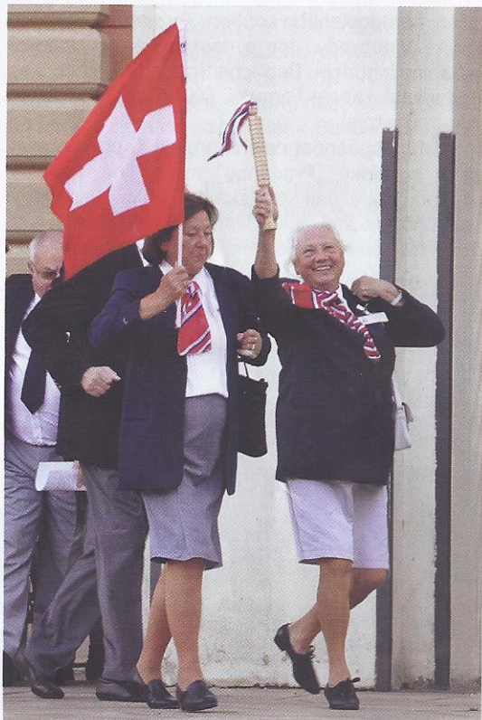
Štafeta ze Švýcarska – Tyršův dům Praha

Dne 25. září 2011 tak všechny štafetové kolíky téměř najednou dorazily na nádvoří Tyršova domu v Praze, kde se uskutečnilo slavnostní přivítání kurýrů a zakončení celé akce.