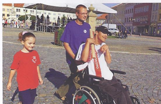
Župa Dr. Bukovského, Vyškov