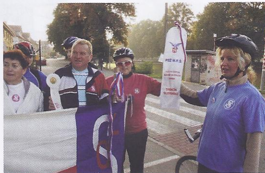
Předání štafety ze slovenského Trenčína župě Komenského