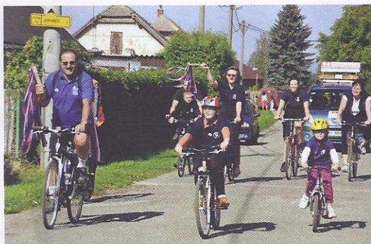
Župa Podkrkonošská – Jiráskova Náchod